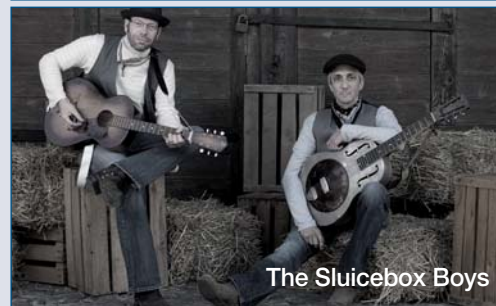
The Sluicebox Boys