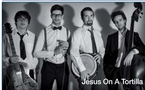
Jesus On A Tortilla