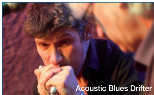
Acoustic Blues Drifter