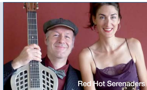
Red Hot Serenaders